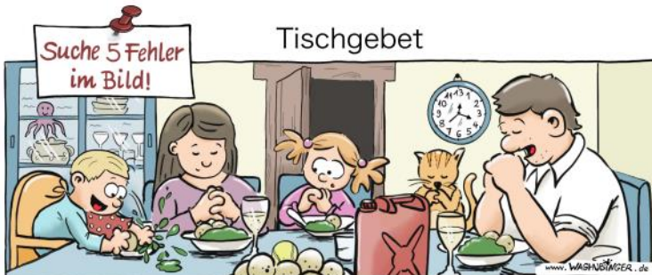
Tintenfsch, Tennisball, Benzinkanister, betende Katze, „13“ auf der Uhr

Die Veranstaltung entfällt bei ungeeignetem Wetter.