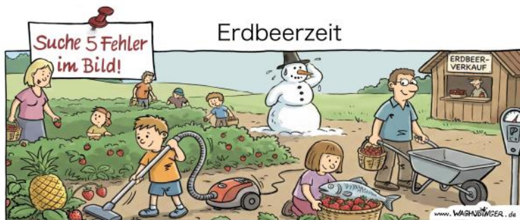
Ananas, Staubsauger, Schneemann, Fisch, Parkuhr